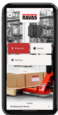
RAVAS Indicator App