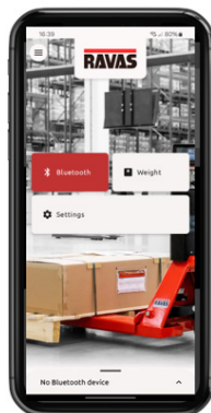
RAVAS Indicator App